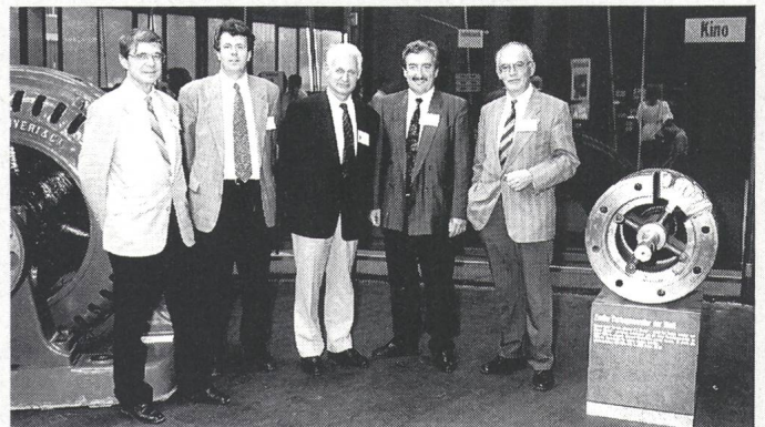
Exkursion zu den Anfängen der Synchronmaschine

Die Synchronmaschine ist seit langem der wichtigste elektromechanische Energiewandler in der Elektrizitätserzeugung wie auch in speziellen Gebieten der Antriebstechnik. Über 99% des elektrischen Stromes wird heute weltweit mit diesem Maschinentyp erzeugt. Die Anfänge der Synchronmaschine und ihre ersten Entwicklungsstufen reichen in das letzte