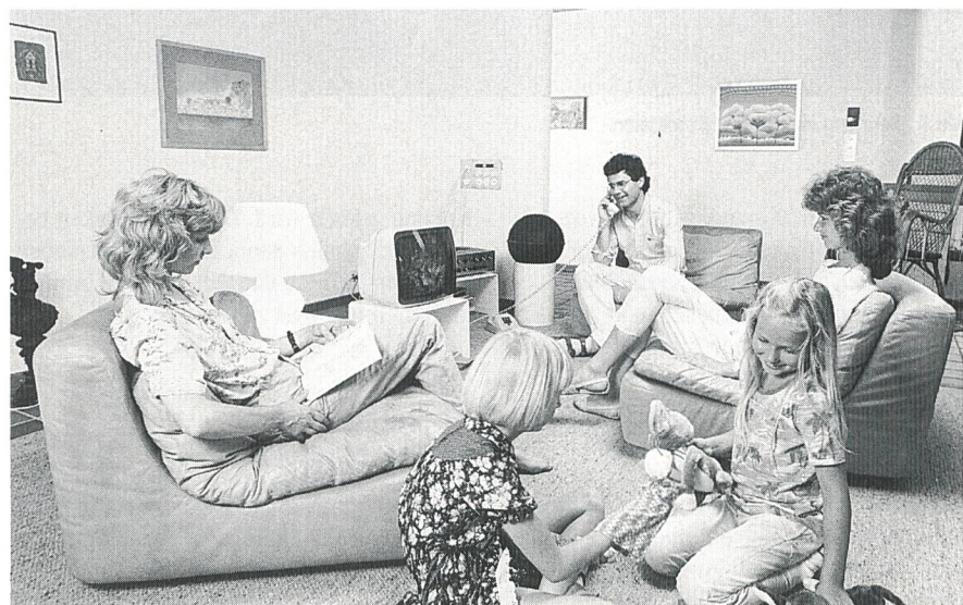
Bild 1 Die Verantwortung für den Stromverbrauch liegt beim Kunden. 1991 stieg zum Beispiel der Stromverbrauch in den Schweizer Haushalten um fast 5%

Hier muss die Elektrizitätswirtschaft Flagge zeigen, und sie tut dies in ausgesprochen engagierter Art. Sie hat das Bekenntnis abgelegt, sich für die Stabilisierung einzusetzen und daraufhin einen umfangreichen Massnahmen-Katalog erarbeitet. Selbstverständ-