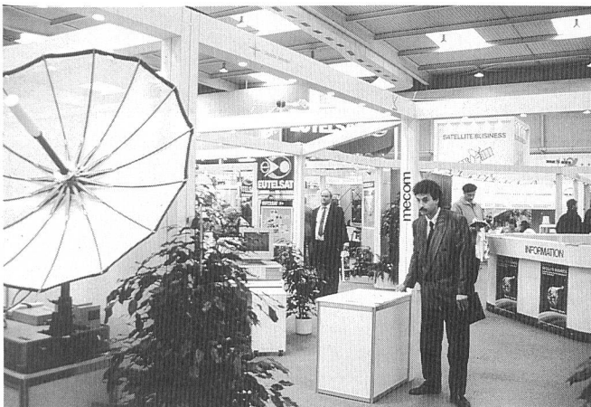
Blick in den Cebit-Bereich Telekommunikation

Das Eidgenössische Amt für Messwesen (EAM) hat der Siemens-Albis AG, Zürich, als erstem Schweizer Telekommunikationsunternehmen die offizielle Akkreditierung als Prüfstelle für Teilnehmeranlagen erteilt. Die Akkreditierung erfolgte aufgrund des vorhandenen Know-