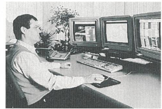
Fernsteuerzentrale Telegyr LS3200

Die Schweizerischen Bundesbahnen (SBB) bauen ihr 15-kV-Fahrleitungsnetz immer mehr für einen ferngesteuerten Betrieb aus. Nachdem im März 1991 die Kreisleitstelle Zürich und im Oktober 1992 die Fernsteuerzentrale Genf den Betrieb aufgenommen haben, wurde kürzlich der Auftrag für eine neue Leitstelle im Unterwerk Bussigny bei Lausanne erteilt. Fernsteuerzentralen sollen dazu beitragen, die für einen zuverlässigen Bahnbetrieb notwendige, mög-