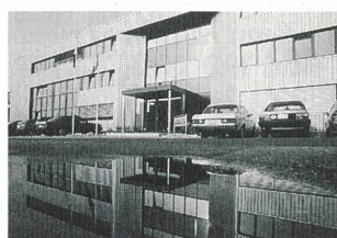
Das neue ABB-Zentrum für Überspannungsableiter in Wettingen

Die neue Fabrik ist in der Lage, die mehreren tausend Kundenaufträge mit weit über 100000 Überspannungsableitern pro Jahr abzuwickeln. Neue Handlinggeräte unterstützen vor allem die Fabrikation der Metalloxidwiderstände, dem Herzstück dieser Ableiter, von denen pro Jahr bis zu 900000 Einheiten