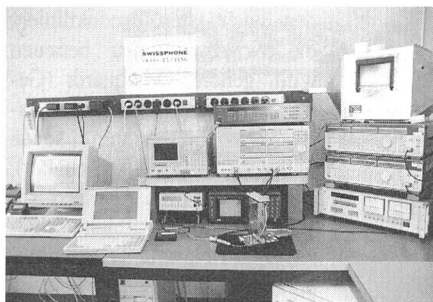
Messplatz für Typen- und Qualifikationsprüfungen

Mit der Liberalisierung im Fernmeldebereich eröffneten sich auch den privaten Unternehmen neue Perspektiven. Erstmals in der Fernmeldegeschichte wurde eine private Prüfstelle für