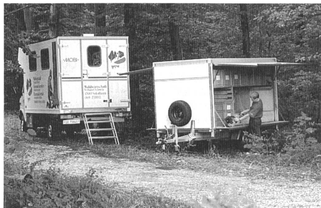
Mobile Ausbildungseinheit Mobi

Bis jetzt war es für viele Interessenten aus zeitlichen Gründen kaum möglich, einen Aus- oder Weiterbildungskurs im und um den Wald zu besuchen. Der Waldwirtschafts-Verband Schweiz meldet nun die Anschaffung einer mobilen Ausbildungseinheit Mobi; sie erlaubt, Kurse jetzt zu den Teilnehmern zu bringen. Die mobile Ausbildungseinheit ist ein rollendes Klassenzimmer, das auf einem allradbetriebenen Transporter aufgebaut ist. Es ermöglicht, abseits von Werkhöfen, einen witterungsunabhängigen Unterricht mit modernen Schulungsmitteln wie Video, Hellraumprojektor usw. In einem Anhänger werden komplette Holzereiausrüstungen mitgeführt. Die Teilnehmerzahl pro Kurs ist auf 4-5 Personen begrenzt.