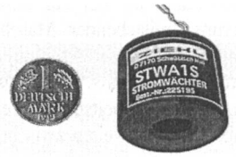
Stromwandler STWA 1 S

ern. Der STWA 1 S wird überall dort vorteilhaft eingesetzt, wo Stromfluss in einer Leitung erkannt werden soll. Umgekehrt kann man mit ihm auch überprü-