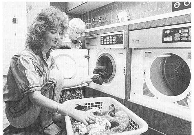
Seit Ende der 50er Jahre verringerte sich der Stromverbrauch der Vollautomaten von 5 kWh/5 kg Trockenwäsche auf 1,8 kWh für die gleiche Menge Wäsche

derschaft gingen. Um fünf Kilogramm Trockenwäsche zu säubern, wurden etwa 200 Liter Wasser und 5 Kilowattstunden Strom verbraucht. Modelle der 90er Jahre kommen bei gleicher Menge mit durchschnittlich knapp 65 l Wasser und 1,8 kWh Strom aus. Allerdings wechseln heute annähernd die Hälfte der Frauen und Männer täglich die Bluse oder das Hemd. Schnell kommt so ein Wäscheberg von