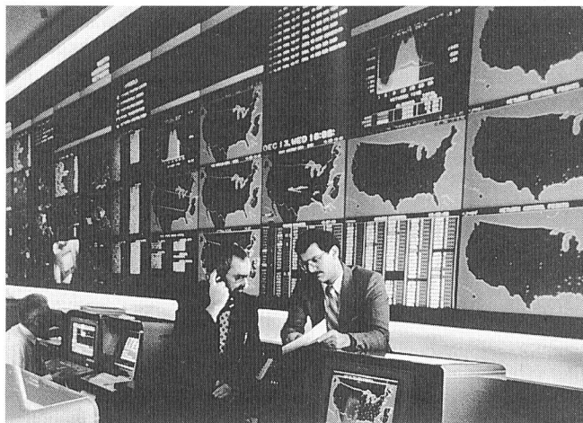
Das Netzwerkkontrollzentrum des amerikanischen Telekommunikationskonzerns AT&T in Bedminster im amerikanischen Bundesstaat New Jersey ist das modernste seiner Art. Es kontrolliert mit leistungsfähigsten Computern ein 3,6 Milliarden Kilometer langes Netzwerk, auf dem Stimme, Daten und Bilder übermittelt werden. Das Netzwerkkontrollzentrum der AT&T, Muttergesellschaft des amerikanischen Computerunternehmens NCR, vermittelt täglich rund 115 Millionen Anrufe

Eine Besonderheit des GSM-Systems ist das Subscriber Identity Modul (SIM) in der Grösse einer Kreditkarte (für Handgeräte in einer Miniversion «Plug-in-SIM»), welches alle für den Zutritt zum GSM-Netz und zur Abrechnung nötigen Daten sowie die persönlichen Daten des Teilnehmers enthält. Die Taxierung der Gespräche erfolgt im Gegensatz zum Natel C nicht geräte-, sondern nummernbezogen (pro Nummer einer SIM-Karte). Damit ist der Teilnehmer nicht an sein persönliches Gerät gebunden und braucht beispielsweise für Auslandsreisen nur seine SIM-Karte mitzuführen.