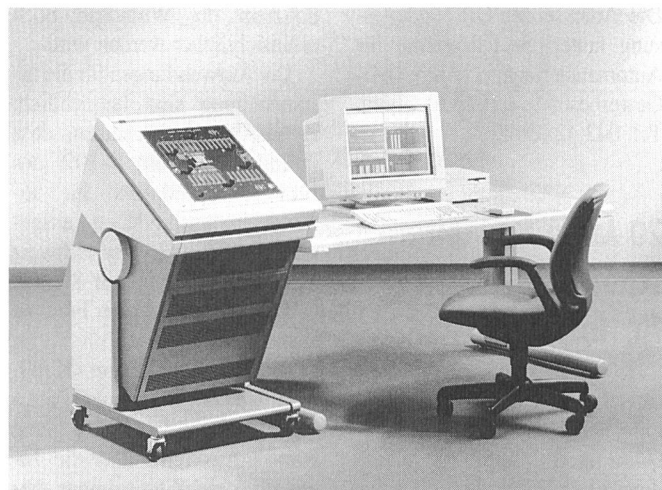
Test-System ATS 125 von IMS

Die Schweizer Niederlassung der SAT Systeme für Automatisierungstechnik wurde um den Bereich Fernwirk- und Leittechnik auf das gesamte Leistungsspektrum der SAT erweitert. SAT Systeme für Automatisierungstechnik AG ist eines der bedeutendsten österreichischen Unternehmen auf dem Gebiet der Automatisierung räumlich verteilter technischer Prozesse.