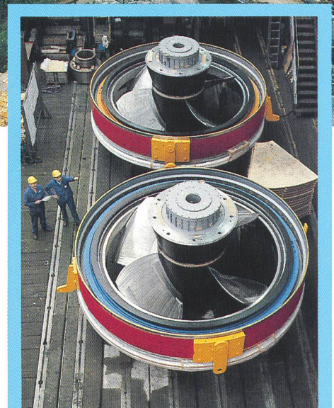
Die Straflo-Laufräder Nr.1 für Augst und Wyhlen sind transportbereit. Vor Ort werden die von ABB gefertigten Generatorpole auf dem Laufradkranz befestigt (Juni 1992).

Umbau – eine ökonomische und ökologische Chance! Die Energieproduktion des Zwillingskraftwerks Augst-Wyhlen am Rhein wird durch den Einbau von insgesamt 13 Straflo-Turbinen um mehr als 65 Prozent auf über 400 GWh erhöht. Die jährliche Mehrproduktion entspricht etwa dem Elektrizitätsbedarf von 30 000 Haushalten. Das äussere Erscheinungsbild des Kraftwerks bleibt unberührt, ebenso wie die in den 80 Jahren gewachsenen ökologischen Strukturen im Ober- und Unterlauf.