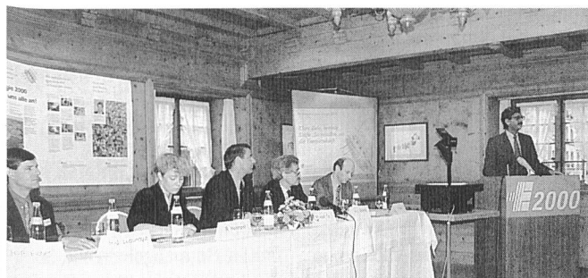
Vertreter der Aktionsgruppen von «Energie 2000» an der Pressekonferenz

Bundespräsident Ogi bezeichnete das Aktionsprogramm als Chance für die Schweiz. Das Programm hilft wesentlich mit, die Umwelt zu schützen. Es bildet den schweizerischen Beitrag zur Lösung des globalen Klimaproblems. «Energie 2000» sichert die Energieversorgung und schafft Arbeitsplätze in zukunfts-trächtigen Bereichen. Bereits ist die Schweiz weltweit führend, beispielsweise auf dem Gebiet leichter Elektromobile.