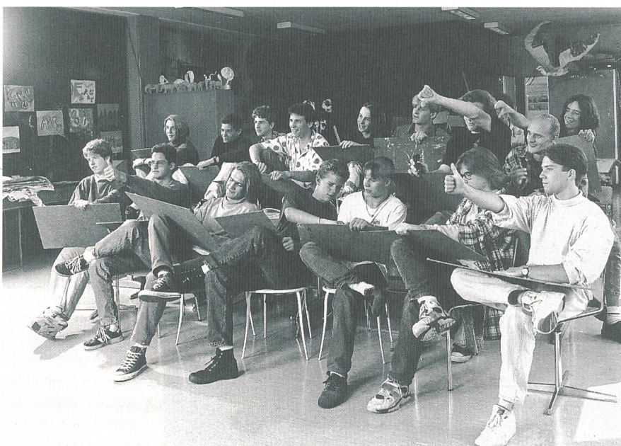
Bild 5 Blick ins energiegerechte Klassenzimmer