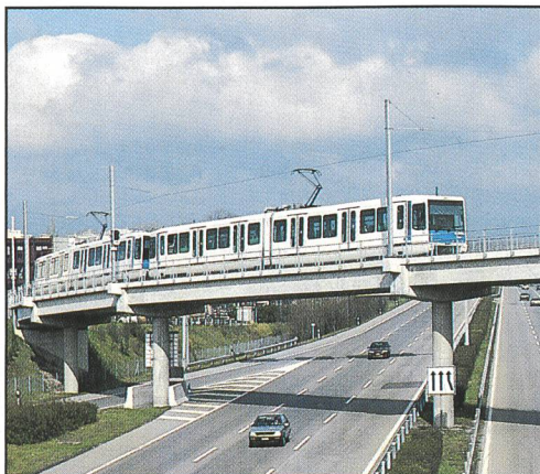
Die TSOL verbindet die Hochschulen (UNIL und ETHL) mit dem Zentrum der Stadt Lausanne