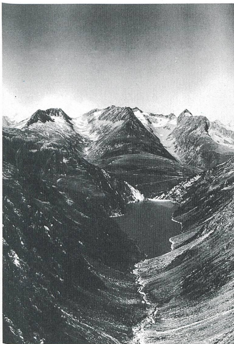
Auch für Wasserkraft genutzte Landschaften können naturgerecht sein: Stausee Curnera (GR)

Autrement dit, chaque village pouvant se prévaloir d'un cours d'eau susceptible d'accueillir une turbine pourra passer à la caisse. Il lui suffira de démontrer l'existence d'un potentiel énergétique sur son territoire pour toucher, chaque année, entre 150 000 et un million de francs selon l'importance de l'installation qu'il renonce à construire.