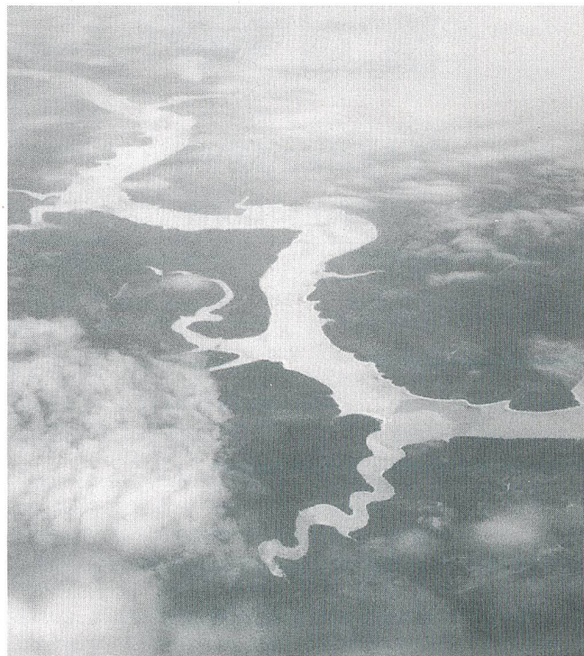
Unerschlossenes Sibirien: Wasserkraftpotential am oberen Jenissei

Am 31. Dezember 1992 wurde hierzu die Russische Energie- und Elektrifizierungs AG (RAO) gegründet. Aufgabe von RAO ist die sichere Steuerung und Versorgung des gesamten Verbund-