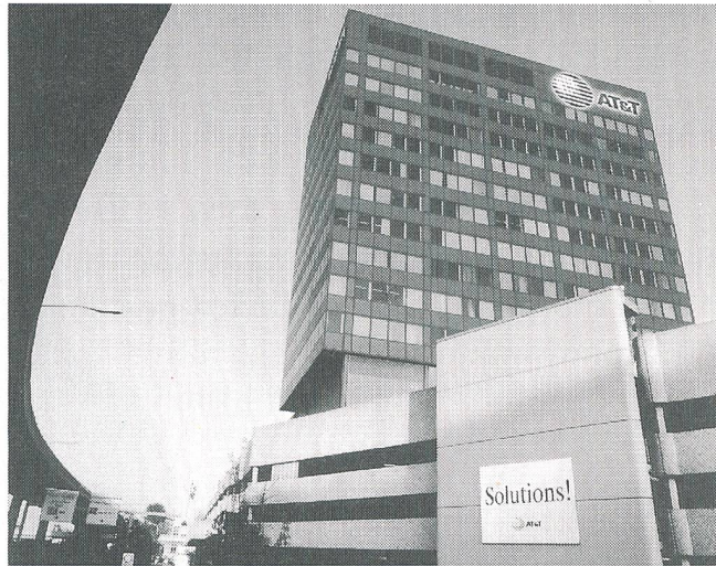
NCR ist nicht umgezogen, sondern hat einen neuen Namen (Fotomontage)

Die Telecom PTT haben mit der Ascom Business AG, der Siemens-Albis AG und der DeTeWE Telecom AG auf Ende 1993 neue Zusammenarbeitsverträge über den Vertrieb privater Teilnehmervermittlungsanlagen abgeschlossen. Alcatel STR und Telepax – bis anhin ebenfalls begünstigte TVA-Lieferanten – sind nicht mehr unter den Vertragsfirmen zu finden. Die neuen Verträge geben den Kunden die Wahl, ihre TVA direkt bei den Her-