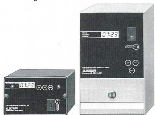
Bicont 803 – die bargeldlosen Gebührenautomaten

Exklusiv für Elektrizitätswerke: der EW-key zum Einziehen fälliger Stromrechnungen.