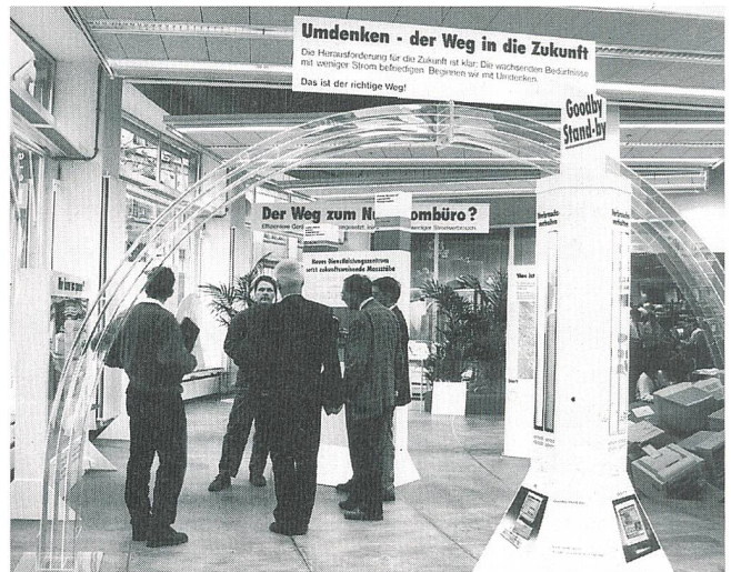
Die Ausstellung propagiert nicht den Weg zurück zu weniger Komfort, sondern den Weg zu überlegter und rationeller Stromanwendung

(infel) Eine Ausstellung mit dem provokativen Titel «Der