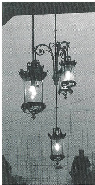
Alte Strassenlaternen am Zürcher Hauptbahnhof

(iwb) In den Auslagen der Schweizerischen Kreditanstalt in Basel konnte man von Mitte Oktober bis Ende November eine Ausstellung über nostalgische Strassenlaternen bewundern. Die Industriellen Werke Basel (IWB) und die Schweizerische Kreditanstalt (SKA) zeigten die schönsten Exemplare aus der Sammlung