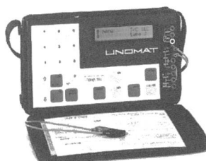
Portabler Multi-Kalibrator TRX

Das Instrument ist leicht bedienbar, da alle Funktionen über ein Menü angewählt werden. Ein- und Ausgangsgrößen werden deutlich und unmissverständlich angezeigt. Bis zu sechs oft benutzte Funktionen können vorprogrammiert und verschiedenen Tasten zugeordnet werden. Die Simulations-Ausgabesignale können manuell in zwei Geschwindigkeiten rampenförmig auf- oder abwärts gefahren werden. Für dynamische Tests im Automatikbetrieb erfolgt die Ausgabe pro-