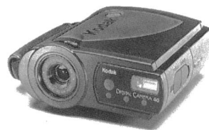
Westentaschentauglich: Kodak DC 40

Der neue ADPCM-Sprachprozessor MSM 6688 ist für eine dynamische 32-MBit-Speicher-Schnittstelle ausgelegt und unterstützt Aufnahmezeiten von bis zu 35 Minuten. Ein 12-Bit-A/D-Wandler und ein 12-Bit-D/A-Wandler sowie der integrierte Tiefpassfilter (–40 dB/Oktave) sorgen für eine ausgezeichnete Sprachqualität mit Bitraten von 12 bis 64 kBit/s. Diese sind mit Abtastfrequenzen von 4,0 bis 16 kHz definiert. Für die Speicherung eingehender Mitteilungen können in Kombination mit einem Interface-LSI, dem MSM6791, dynamische RAM-Chips mit Kapazitäten von 1, 4 und 16 MBit eingesetzt werden. Wahlweise bieten sich die seriellen Sprachregister von OKI an, die ohne Interface auskommen. Ausserdem können Sprach-ROM mit bis zu 4 MBit für feste Ansagetexte, wie beispielsweise die Zeitangabe, angeschlossen werden. Der Prozessor bietet 64 Auf-