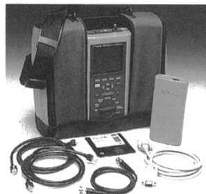
Fluke DSP-100 LAN Cable Meter

Speziell wenn im gemessenen Link Impedanzfehler oder die geforderten Next-Neben-