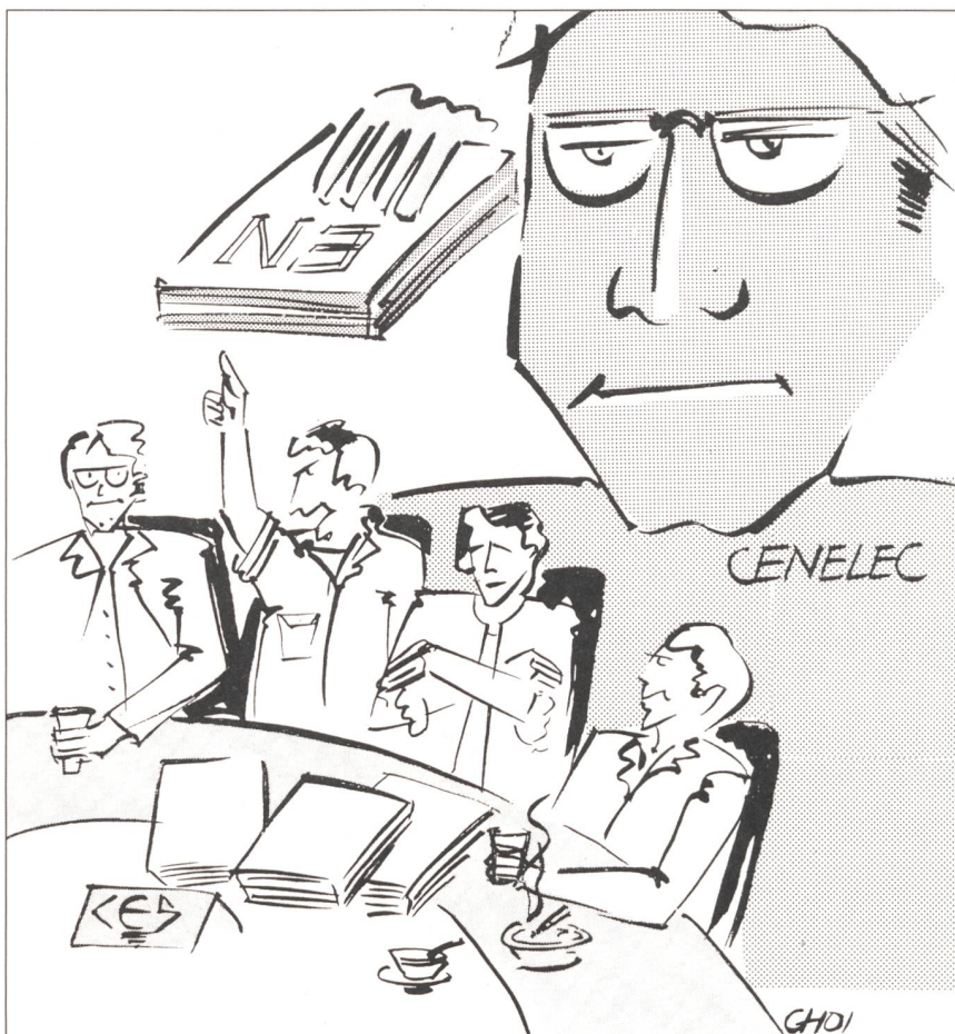
Big Brother watching you?

In der IEC gilt, dass eine WG-Mitgliedschaft nur möglich ist, wenn das entsprechende nationale Arbeitsgremium (TK) im relevanten TC oder SC aktive Mitarbeit leistet, also sogenanntes P-Mitglied ist. Eine Limite der Anzahl WG, in denen sich ein Experte engagieren möchte, wird nicht gegeben. Was verlangt wird, ist engagierte, konstruktive Mitarbeit. Die erwähnte P-Mitgliedschaft beinhaltet insbesondere die Pflicht, an den TC- oder SC-Sitzungen und an (allen) Abstimmungen über die Normenprojekte teilzunehmen. Eine gute