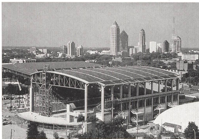
Das grösste dachintegrierte Solarkraftwerk der Welt auf dem Schwimmstadion in Atlanta.