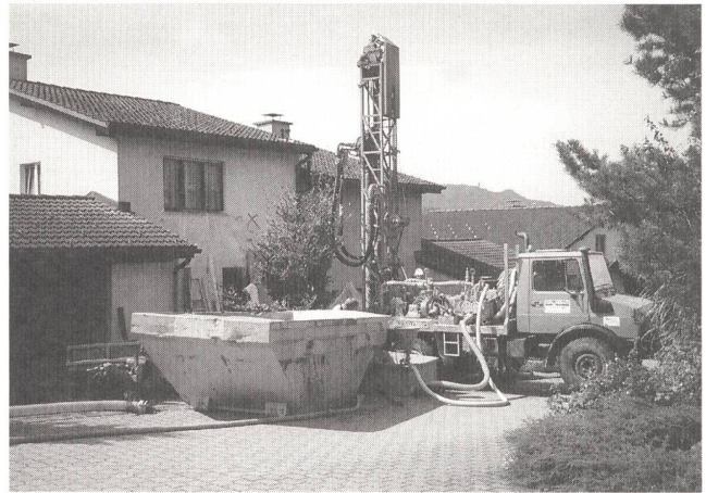
Bild 5 Bohrarbeiten für die Verlegung der Erdsonden zur Heizung eines Einfamilienhauses mit Erdwärme in Gattikon.

Heizsystem. Der technische Speicher fasst je 200 Liter. Durch die energetische Sanierung dieser Einfamilienhäuser und dank der verbesserten Wärmeisolation im Fassaden-, Fenster- und im Dachbereich ist heute eine Reduktion des Heizenergiebedarfs auf 50% zu verzeichnen.