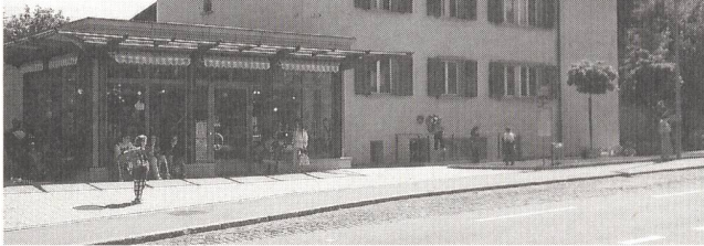
Bild 4 In diesem Mehrfamilienhaus in Birmensdorf wurden zwei Luft-Wasser-Wärmepumpen mit je zwei Kompressoren installiert.