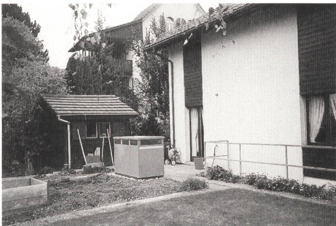
Bild 1 Monovalente Luft-Wasser-Wärmepumpe in Aussenaufstellung (links) bei einem Einfamilienhaus in Seuzach ZH.

Die EKZ betreiben übrigens bereits seit dem Jahre 1982 in eigenen Liegenschaften Wärmepumpenanlagen. Bis heute wurden unzählige Anlagen (Luft-Wasser-, Erdsonden-, monovalente und bivalente Systeme) mit verschiedensten Wärmepumpenfabrikaten realisiert und nachbetreut. Die Erfahrungen aus Planung und Betrieb solcher Heizsysteme werden jeweils unter anderem mit der fahrbaren Ausstellung, dem Wärmepumpen-Infomobil der EKZ, an interessierte Bauherren, Hausbesitzer