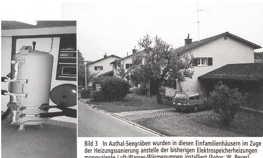
Bild 3 In Aathal-Seegräben wurden in diesen Einfamilienhäusern im Zuge der Heizungssanierung anstelle der bisherigen Elektrospeicherheizungen monovalente Luft-Wasser-Wärmepumpen installiert.

In Aathal-Seegräben (Bild 3) konnte die eingeladene Bevölkerung zwei der in insgesamt fünf älteren, heute sanierten Einfamilienhäusern installierten monovalenten Luft-Wasser-Wärmepumpen (Fabrikat: Stiebel Eltron) in Innenaufstellung besichtigen. Pro Haus beträgt die beheizte Fläche bei diesen freistehenden und baugleichen Gebäuden 120 m 2 . Die Heizleistung beträgt rund 5 kW bei -8^{\circ}\text{C} Aussentemperatur und bei 46^{\circ}\text{C} Vorlauftemperatur. Die neu installierten Wärmepumpen dienen als Ersatz für das frühere Elektrospeicher-