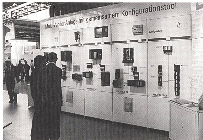
In einer Live-Applikation konnten sich die Besucher der Swiss Automation Week von der vollen Interoperabilität der Feldgeräte untereinander und mit den verschiedenen SPS-Systemen überzeugen.

Auf der diesjährigen Swiss Automation Week in Basel wurden die ersten Resultate der gemeinsamen Anstrengungen demonstriert. Die Messebesucher konnten sich in einer Live-Applikation von der Interoperabilität der Feldgeräte untereinander und den SPS-Systemen sowie der einfachen