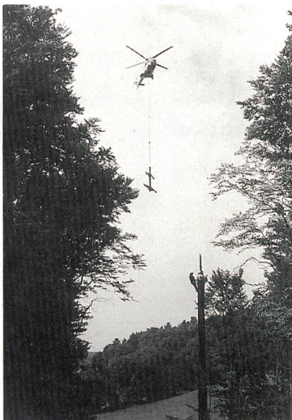
Bild 1 3,3 Tonnen kommen durch die Luft.