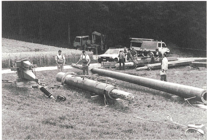
Bild 4 Gelände für die Zwischenlagerung.

Dieses Publikum wusste über die Dienste, die ein Hubschrauber erweisen kann, und über die relativ geläufige Ver-