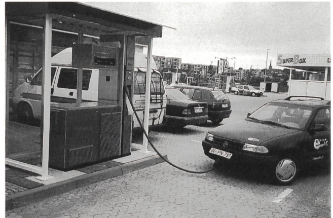
Grossversuch mit E-Mobilen auf der Insel Rügen.