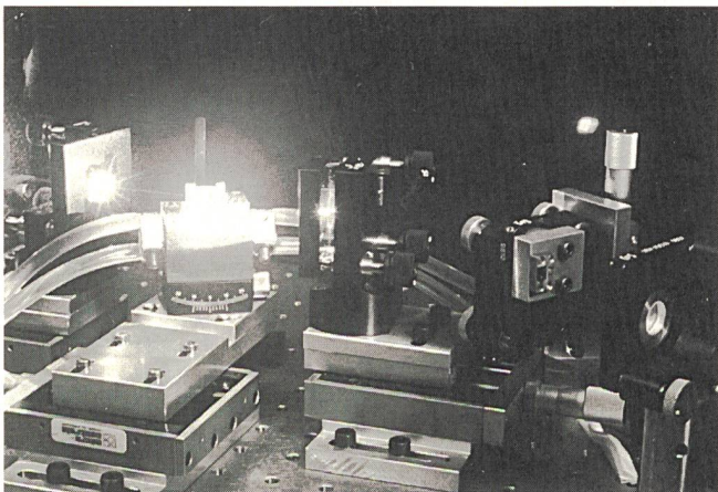
Der Titan-Saphir-Laser, auf dem die Experimente durchgeführt wurden.

Die Dornier Satellitensysteme GmbH (DSS) in Friedrichshafen und das georgische Institut für Weltraumkonstruktionen (IWK) in Tiflis untersuchen gemeinsam die Realisierbarkeit einer grossen Entfaltantenne für Kommunikationssatelliten. Mit diesem ersten Schritt einer deutsch-georgischen Kooperation in der Raumfahrt werden die technische Machbarkeit einer Antenne mit 12 bis 17 Meter Durchmesser sowie der Markt für ein solches Produkt analysiert. Mit solchen Antennen könnten in Zukunft geostationäre Mobilfunksatelliten ausgerüstet werden, die das Telefonieren per Handy ermöglichen. So kann ein einziger Satellit kostengünstig den Mobilfunk einer Region ermöglichen. Herkömmliche Mobil-