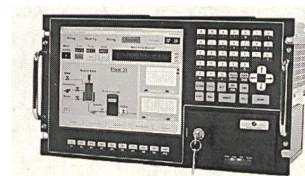
19-Zoll-Rackrechner der Serie Optimization

Zoll-Rackrechner. Das Produktkonzept beinhaltet verschiedene Rechnervarianten mit sechs Höheneinheiten, die mit Kon-