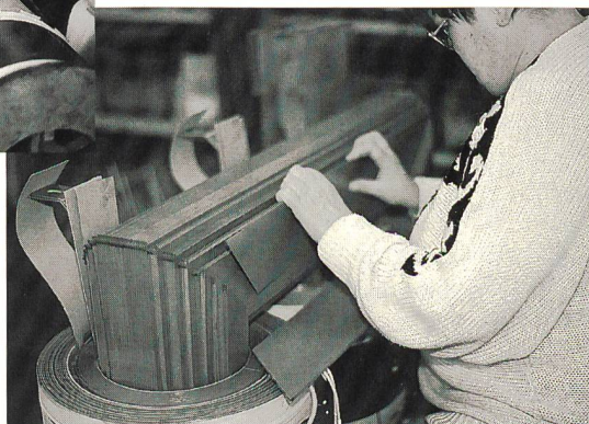
Bild 1 Transformatorenbau mit Maschine und Handarbeit