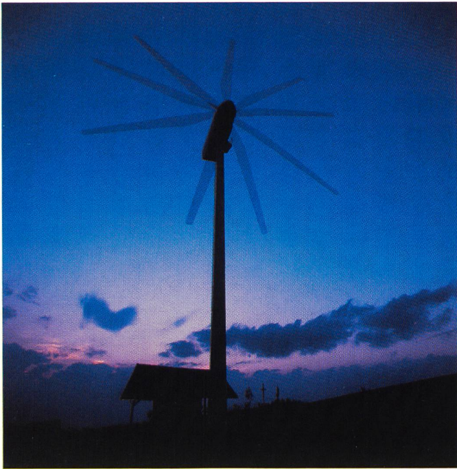
Bild 3 Windkraftanlage in Breitnau im Südschwarzwald: 25 Rappen/kWh.

Die Branche erzielte nach Angaben des DFS mit rund 5000 Beschäftigten im Jahr 1995 einen Umsatz von etwa 500 Millionen DM. Die Inlandsproduktion kann nur einen Teil der Nachfrage decken, so dass gegenwärtig 40% importiert werden müssen. Durch Kapazitätserweiterungen und Qualitätssteigerungen wollen die deutschen Hersteller mittelfristig auch im Ausland verstärkt präsent sein. Weitere Kostenreduktionen, eine vereinfachte Montage und ein besseres Marketing für diese sinnvolle Technik, auch in unseren Breiten, werden zu einer stärkeren Marktdurchdringung beitragen.