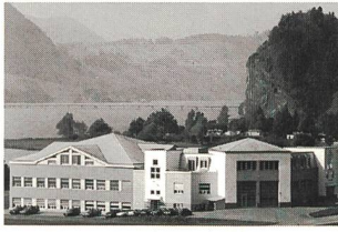
Das 1990 erstellte Gebäude direkt am Sihlsee

Die Silac AG in Euthal, spezialisiert auf Designverschlüsse für Flaschen, Dosen und Tuben, kann ihr 50-Jahr-Jubiläum feiern. Begonnen hat alles seinerzeit mit der Herstellung der Uniformknöpfe für die Schweizer Armee. Heute hat das Unternehmen dank grossen Investitionen neue Märkte erschlossen und zählt zu den führenden Anbietern von Verschlüssen für Flaschen, Dosen und Tuben aus Thermo- und Duroplasten. Das Kunststoffwerk sorgt mit seinen hochwertigen Schraub-, Steck-, Scharnier- oder Garantiverschlüssen dafür, dass Kosmetikfläschchen und -dosen, Getränke- und Sportflaschen die Designver-