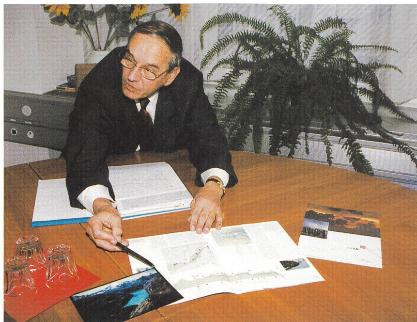
Bild 2 «Ich zeige Ihnen etwas an einem aktuellen Beispiel: Hier haben wir den See und die Stufen, die gebaut wurden.»

den heutigen gesetzlichen Rahmenbedingungen, also Wasserzinsen und Restwasser, hätten wir mit diesem zusätzlichen Wasser Elektrizität zum Preis zwischen 6 und 7 Rp./kWh produziert. Die Qualität wäre vor allem Sommerenergie, man hätte sie zu Hochtarifzeiten umlagern und damit etwa 70 GWh neue Energie im Jahr produzieren können. Unsere Partner sind zum Schluss gekommen, dass wir keine einzige Kilowattstunde mehr