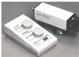
Schwarzweiss-CCD-Kamera VX 44

In der Mikroskopie sind Objekte oft nur mit wenig Kontrast auf hellem Hintergrund sichtbar. Durch Verschiebung des Offsets und anschließende Verstärkung des Videosignals ist mit dem VX-44-Microscope eine deutliche Kontrastverbesserung möglich. Auch schwie-