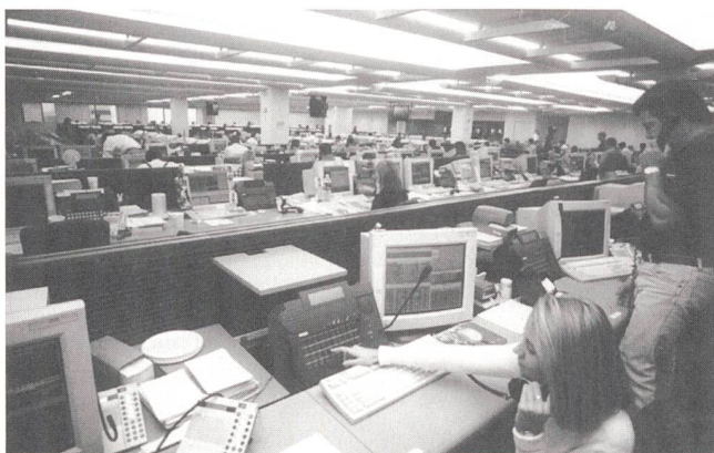
Das Händler- und Börsentelefon Hicom Trading von Siemens (made in Switzerland) schafft weltweite Verbindungen in Sekundenbruchteilen – auch im World Trade Center in New York.

Einher mit der stetig wachsenden Zahl der Firmeneröff-