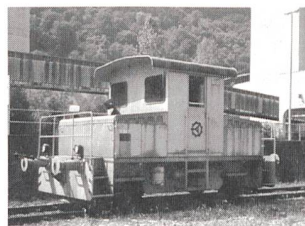
Die Rangierlok Stadler Ta 2/2 soll modernisiert werden.

wird direkt die Fahrgeschwindigkeit bestimmt. Durch die neue Parallel-/Serie-Schaltung der zwei Akkumulatoren mit 180/360 Volt und die Parallel-/Serie-Schaltung der Gleichstrommotoren können 14 Fahrstufen realisiert werden. Im unteren Fahrbereich wird mit der feineren Abstufung praktisch ein stufenloses Fahrverhalten erreicht. Allerdings ist in diesem Betrieb der Wirkungsgrad der Lok recht ungünstig, weil ein grosser Teil der Spannung über den Vorwiderständen in Wärme umgewandelt wird.