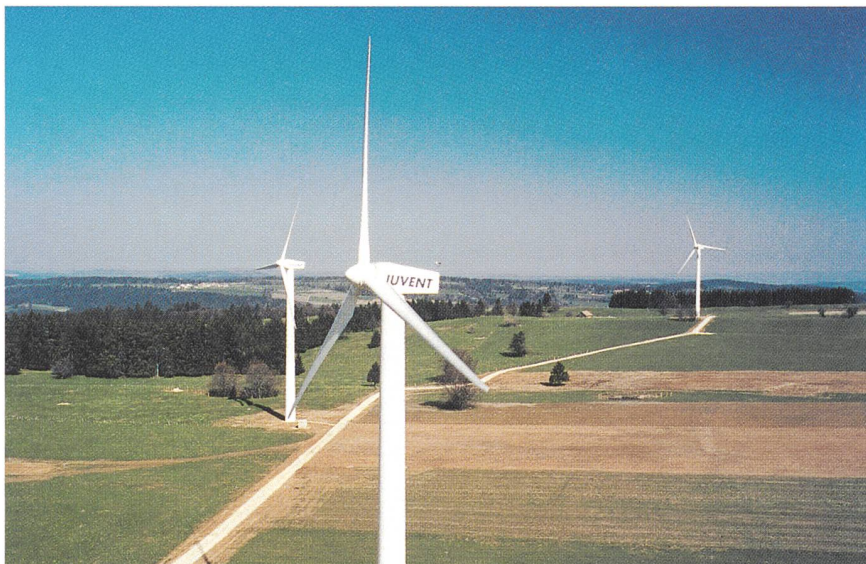
Bild 2 Trotz windschwachem Jahr wurden 1997 auf dem Mont-Crosin erstmals in der Schweiz 1000 Vollaststunden mit einer Windkraftanlage erreicht.

namentlich auch ohne Quersubventionen). Das für die Schweiz neuartige Marktmodell der JUVENT ist gestützt auf europäische und amerikanische Erfahrungen mit Blick auf die bevorstehende Öffnung des Elektrizitätsmarktes entwickelt worden. Es beinhaltet für den interessierten Kunden verschiedene Wahlmöglichkeiten. Er kann kleinere oder grössere Jahrestrachten kaufen, mehrjährige Kaufverträge abschliessen oder sich Windenergie im Contracting-Modell sichern.