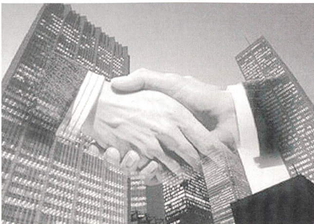
Beim Handshake zwischen Siemens und Landis & Gyr hat die technische Kompetenz der Zuger dem Standort Schweiz Erfolg beschert.

Existierende Verfahren zur Darstellung dreidimensionaler Bilder benötigen spezielle Brillen, Prismen oder andere teure