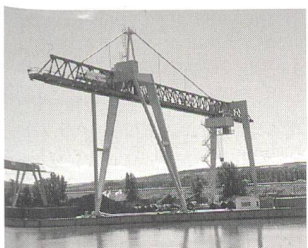
Verladebrücke im Hafen Krems.

(hk) Die Firma Künz in Hard/Vorarlberg am Bodensee, weltweit als Spezialkranhersteller und Lieferant von stahlwasserbaulichen Ausrüstungen tätig, ist derzeit in der Produktsparte Containerkrananlagen erfolgreich aktiv. Nachdem bereits im ersten Halbjahr 1998 drei Containerkrananlagen für das neue Güterverkehrsterminal der DBAG in Kornwestheim bei Stuttgart, eine Anlage für die Spedition Welz in Salzburg und eine Brücke für den