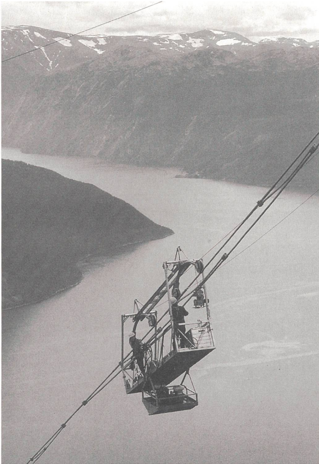
Bild 2 Montagearbeiten an Hochspannungsleitung über den Sognefjord.