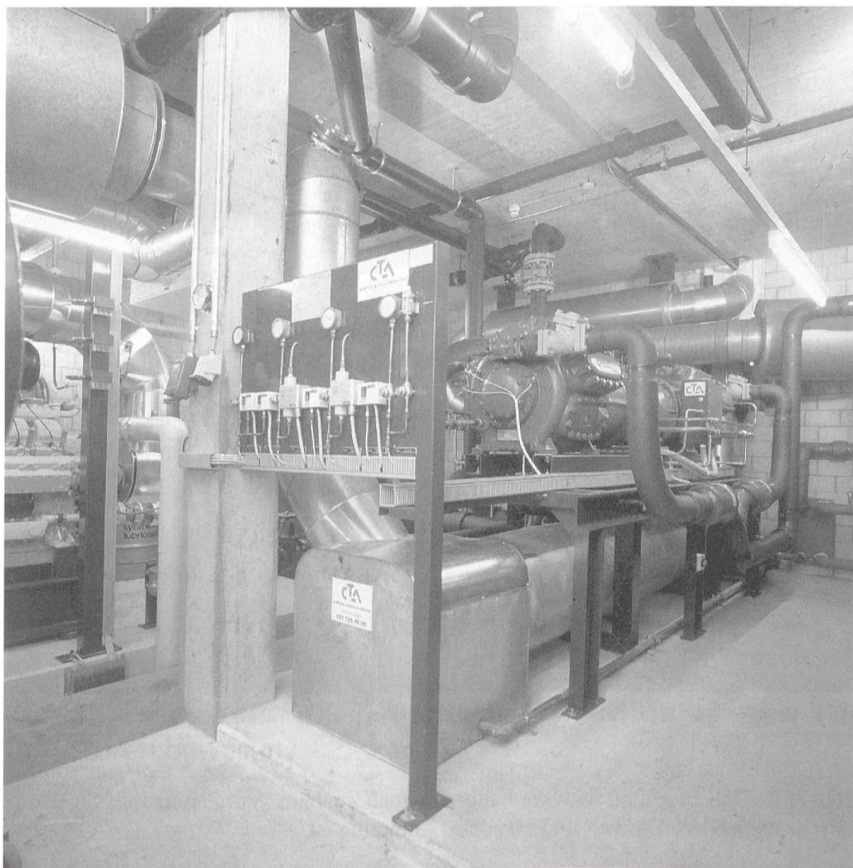
Bild 2 Wasser/Wasser-Elektromotorwärmepumpe von CTA AG mit 640 kW Heizleistung.