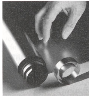
Elektromechanische Folie mit vielseitigen Anwendungsmöglichkeiten

stische Verformung des Piezokristalls. Das wird unter anderem für die Ultraschallerzeugung ausgenutzt. Für viele Anwendungen sind Piezokeramiken jedoch aufgrund ihrer geringen Verformbarkeit ungeeignet. Die finnischen Firmen Messet Ltd und VTT Chemical Technology of Finland haben daher eine Polypropylenfolie entwickelt, die dank ähnlichen elektromechanischen Eigenschaften wie ein Piezokristall