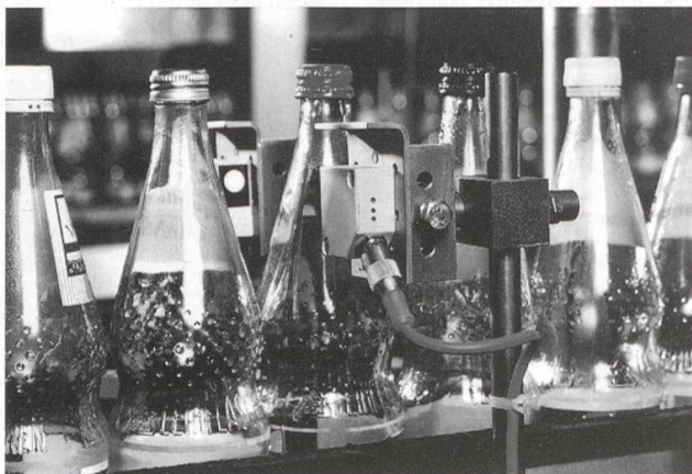
Ultraschallsensor statt Lichtschranke

Bei einer Reichweite bis zu 1,5 m und einer Schaltfrequenz von 200 kHz erkennt der integrierte Mikroprozessor auch bei schwierigen Umgebungsbedingungen schnell und störungsfrei Objekte unterschiedlichster Beschaffenheit.