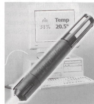
Komfortable Feuchtigkeitsmessung mit Hilfe des PC

Warum schneit es? Warum beschlägt der Badezimmerspiegel nach einer heissen Dusche? Diese und viele andere Fragen beantwortet unser Feuchte-/Temperaturfühler Hygrowin, der direkt an die RS232-Schnittstelle eines PC angeschlossen werden kann. Die