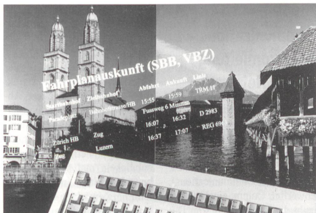
Correspondances d'un bout à l'autre du pays.