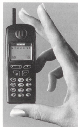
Dualband-Handy C25 für Einsteiger

Das Dualband-Handy C25 unterstützt Triple Rate, das heisst es funktioniert im GSM-900er- und im GSM-1800er-Netz und wechselt automatisch hin und her. Damit passt es sich flexibel allen Telefonkarten und Netzumgebungen an und bleibt zum Beispiel auch bei Kapazitätsengpässen im Mobilfunknetz einsatzbereit. Siemens orientiert sich an jungen Mobilfunkeinsteigern im Alter zwischen 15 und 29 Jahren, da