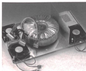
Netzteil mit Ringkerntrafo

fenau eröffnet, in dem vor allem die Blechverarbeitung untergebracht ist. Mit modernsten Maschinen werden unter anderem Gehäuse für IBM oder Glasfaser-Kabelendgestelle und Baugruppenträger für die Telecom hergestellt. Angefangen bei einem Blech mit aufgegossenem Trafo bis zum vollständigen Ladegerät für den militärischen Einsatz kann Sedlbauer alle unterschiedlichen kundenspezifischen Gesamtlösungen anbieten.