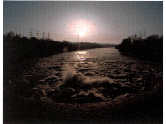
Titelbild: Öffnung der Strommärkte: Im Bild Hochspannungsleitungen über den Rhein bei Laufenburg.

Photo de couverture: Libéralisation des marchés de l'électricité: lignes à haute tension traversant le Rhin près de Laufenbourg.