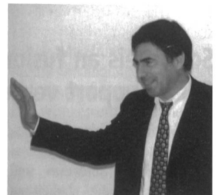
Nationalrat Christoph Eymann begrüsst zwar die Solarstromangebote der Elektrizitätswerke, für ihn ist aber erst die vorgesehene Energieabgabe das richtige Mittel für eine wirkungsvolle Förderung der Sonnenenergienutzung.

mer nur im Verbund mit anderen Erzeugungstechnologien sinnvoll, um den jeweiligen Bedarf decken zu können. Im Gegensatz zu Nationalrat Christoph Eymann, der in der vorgesehenen Energieabgabe das wirkungsvolle Mittel zur weiteren Förderung dieser Technologie sieht, stehen für ihn weniger Subventionsmodelle als die Unterstützung von Forschung und Entwicklung und kundenorientierter Angebote zu kostendeckenden Preisen zur Entwicklung des Marktes im Vordergrund.