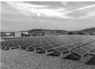
Mit insgesamt 2392 Modulen und einer Leistung von 270 kW p ist die Solarstromanlage «Pluto» der Zürcher Freilager AG die grösste Solaranlage der Schweiz auf überbauter Fläche. Auch sie speist in die Zürcher Solarstrombörse ein.

Bereits anfangs der 90er Jahre hatte das Elektrizitätswerk der Stadt Zürich (EWZ) den Stromsparmifonds lanciert, mit dem auch erneuerbare Energien gefördert werden konnten. Beim Solarstrom führte aber der übliche Weg, den Bau von Anlagen zu unterstützen, nicht zum Erfolg. Dies änderte sich rasch mit dem Start der Solarstrombörse im Jahr 1997: Heute sind rund 1500 kW PV-Leistung installiert. «So können auch Mieterinnen und Mieter dieses umweltfreundliche Produkt fördern», betonte ein mit dem Zürcher Pionierprojekt sichtlich zufriedener Stadtrat Thomas Wagner.