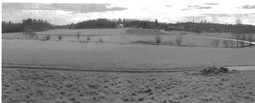
Bild 4 Fallbeispiel Bahn 2000: Die von der neuen Eisenbahnlinie betroffene Landschaftskammer Hersiwil soll mit einer Tunnelverlängerung besser geschützt werden.

Kategorie 3: Realisierung nicht vertretbar. In diesem Fall ist abzuklären, ob nicht einzelne Massnahmenteile mit verbesserter Effizienz bzw. Effektivität (mittel bis hoch) realisiert werden können.