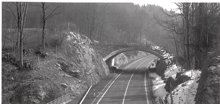
Bild 1 Wildbrücken – typische Naturschutzmassnahme an Verkehrsachsen

Die Kosten von Schutzmassnahmen werden auf Grund von Kostenangaben in der Projektierungs- oder Planungsphase berechnet. Bei Massnahmen, die noch an-