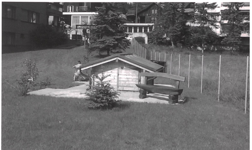
Bild 1 Heutiger Zustand des Bohrlochkopfes, als Chalet getarnt.

H. Füglistner AG Seestrasse 54 6353 Weggis