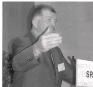
Der Swissolar-Präsident, Ständerat Bruno Frick, bei seinem engagierten Apell an alle Teilnehmer, sich gemeinsam für die Photovoltaik einzusetzen.