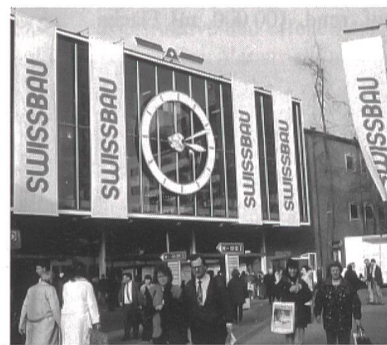
Swissbau 2000, die grösste Schweizer Baumesse, vom 25. bis 29. Januar in Basel.