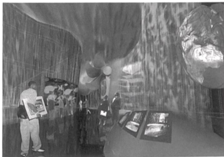
Die Unterwasserwelt in der Themenparkhalle Energie (vom 1. Juni bis 31. Oktober 2000 an der Weltausstellung in Hannover).

(pm) An der 6. Schweizerischen Energieforschungskonferenz vom 3. und 4. November in Bern diskutierten über 100 Energiefachleute aus Industrie, Verwaltung, Wissenschaft und Politik über die Zukunft der Energieforschung in der Schweiz. In seiner Eröffnungsrede unterstrich Eduard Kiener, Direktor des Bundesamtes für Energie, die Bedeutung der Energie-Lenkungsabgabe und empfahl dem Souverän, die Subventionsabgabe anzunehmen. Zusätzlich wies der BFE-Direktor auf die Bedeutung des Förderabgabebeschlusses hin und betonte insbesondere die Abhängigkeit der Forschungs-, beziehungsweise der Entwicklungsförderung vom Schicksal des Förderabgabegesetzes. Zentrales Thema der Konferenz war im besonderen das von der Eidgenössischen Energiekommission weiterentwickelte Forschungskonzept des Bundes. Konferenzziel war das Definieren einer gemeinsamen Forschungsrichtung von Wissenschaft, Industrie, Politik und Verwaltung für die nächsten vier Jahre.