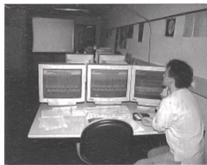
Bildschirmsimulation als Grundlage für den Netzwiederaufbau.

Das Szenario war folgendes: Aufgrund von grossräumigen Leitungsausfällen im benachbarten Ausland kam es zu starken Lastverschiebungen und Pendelungen im Verbundnetz der Schweiz. Dadurch lösten verschiedene Verbundleitungen einen weiträumigen Stromunterbruch aus. Nach einer gründlichen Analyse der Lage stellte sich den involvierten Leitstellen die Aufgabe, ihr Verbund- und Verteilnetz schnellstmöglich wieder aufzubauen. Als erstes mussten alle Unterwerke und Leitungen