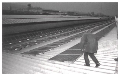
Die Solarstromanlage auf dem Perrondach des HB Zürich bei Einbruch der Dunkelheit.

(pm/eb) Auf dem Perrondach des Hauptbahnhofs Zürich wurde am 16. November eine 50-Kilowatt-Solaranlage eingeweiht. Die Anlage ist seit dem 1. Oktober 1999 in Betrieb und wurde vom energie büro geplant und projektiert. Für die Realisierung von Solarstrom-