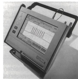
DWDM-Messsystem mit LCD-Bildschirm

stallation und Inbetriebnahme, Wartung und Störungssuche in DWDM-Systemen. Darüber hinaus kann der OSA-155 zu-